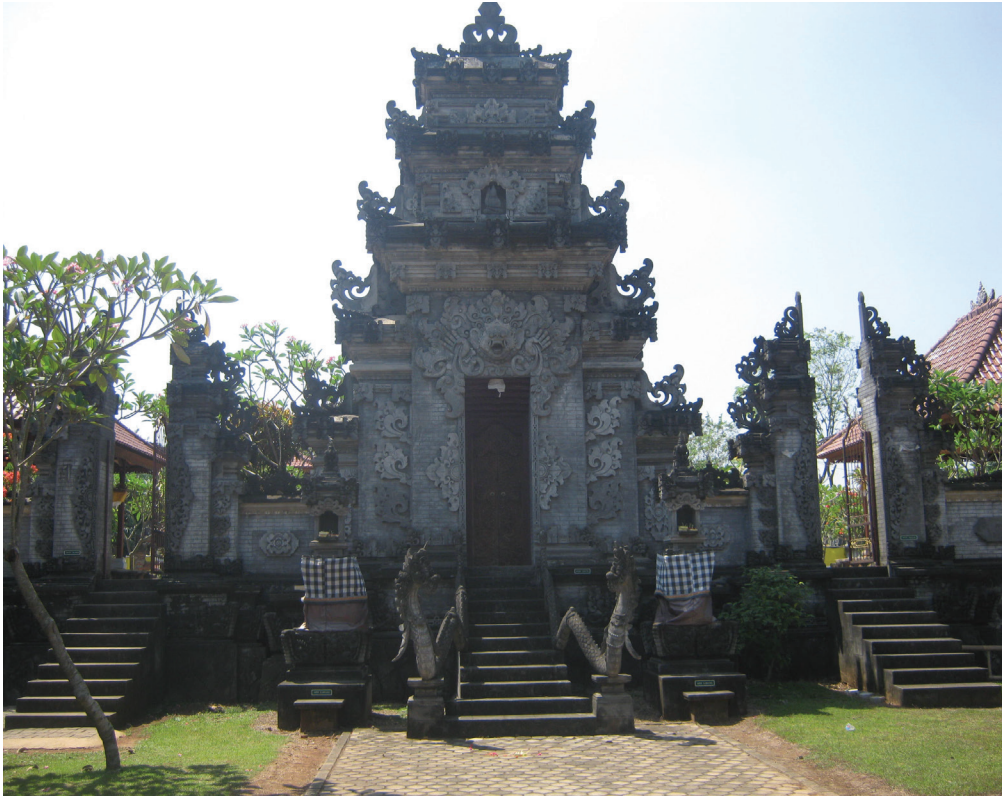
Pura Satya Loka Arcana, Ciangsana, Gunung Putri, Bogor