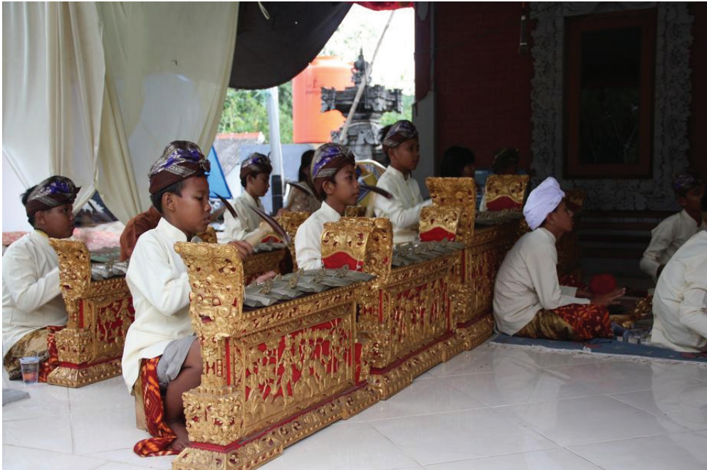
Pura Satya Loka Arcana, Ciangsana, Gunung Putri, Bogor