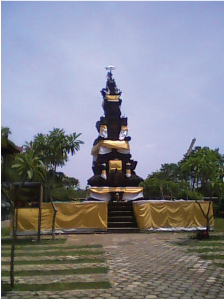
Pura Satya Loka Arcana